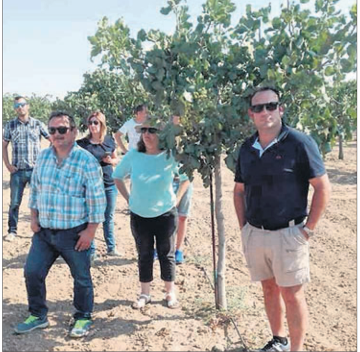
AGRICULTURA. Instalaciones de la planta de procesado que se construye en Navas de San Juan. A la derecha, integrantes del colectivo junto a algunas de las plantas.