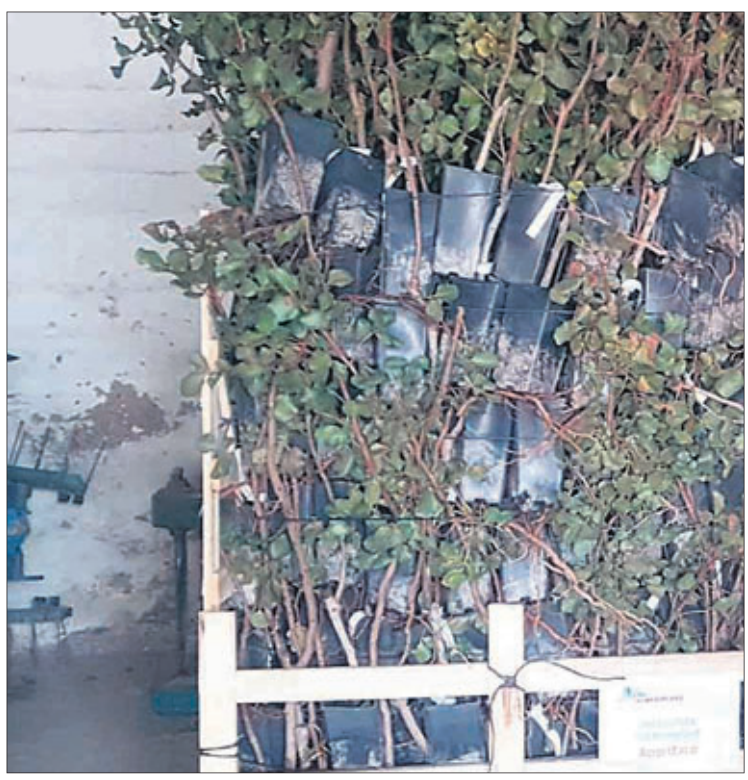
CULTIVO. Plantas preparadas para su plantación.

"Diputación Provincial de Jaén nos apoya asumiendo el asesoramiento técnico y subvencionado las plantaciones, lo que supone una gran ayuda", puntualiza. Sin olvidar al Ayuntamiento de Navas de San Juan, que ha cedido unas